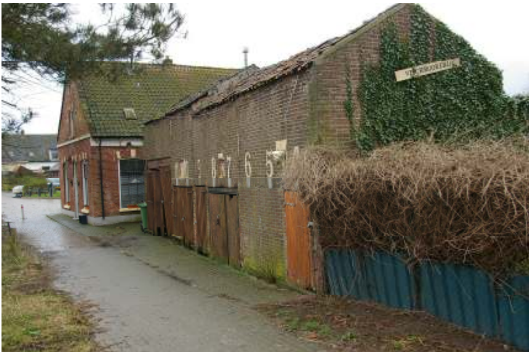
Afb. 6 Rokerij gezien naar het woonhuis. Opvallend is ook het hogere deel (deel B en D waar langs de dakrand de omgebogen uiteinden van de stalen panlatten zichtbaar zijn.