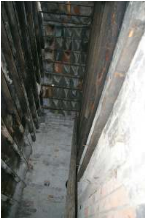
Afb. 9 Gezicht in hang 9 naar boven met aan de linkerkzijde de uitgemetselde bakstenen lijsten en aan de rechterzijde de aan de muur bevestigde houten balkjes.