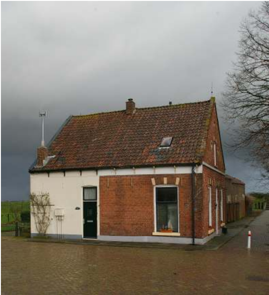
Afb. 3 Aanzicht van het complex vanuit het zuiden.