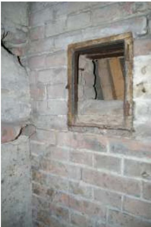
Afb.10 Het gietijzeren controleluikje in hang 9. Dit luikje bevond zich oorspronkelijk in de buitenmuur, waarvan de gevoegde muur nog getuigt.