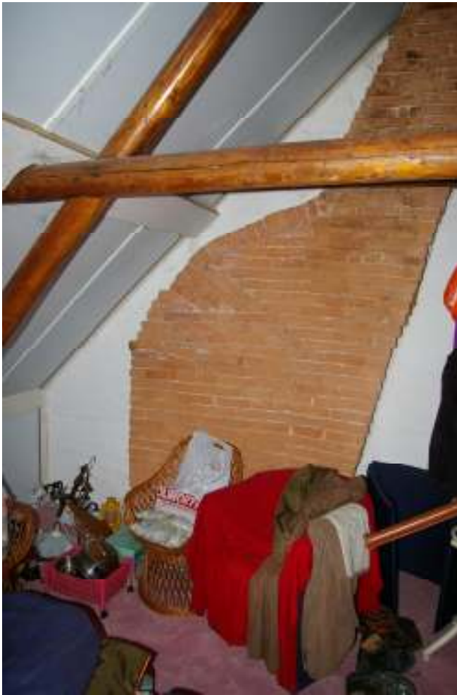
Afb. 4 Zolder oostelijke woonhuis met verbrede schouw waarin vleesproducten te roken gehangen konden worden.