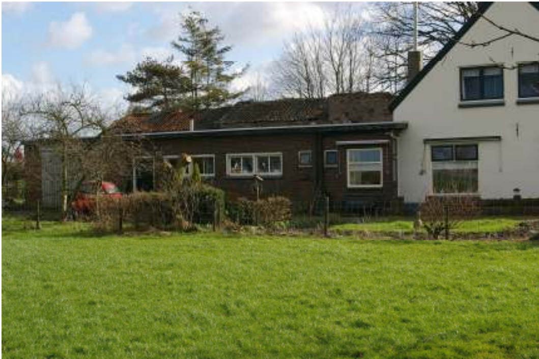
Afb. 5 Complex gezien vanuit het westen met zicht op de haringinleggerij en daarachter de hogere kap van de rokerij.