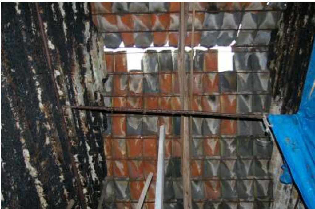
Afb. 8 De hang van deel B gezien naar de nok. De dubbele breedte is ontstaan door de verwijdering van de muur tussen hang 4 en 5. Goed zichtbaar zijn de stalen panlatten en de berookte uitgemetselde bakstenen lijsten.