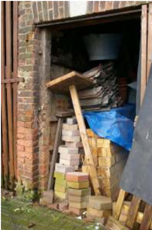
Afb. 7 Toegang tot een hang met zichtbaar de duimen van de boven- en onderdeuren.